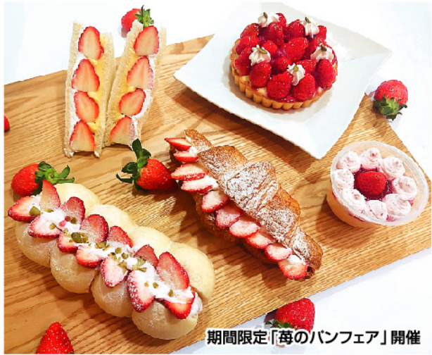
期間限定「苺のパンフェア」開催