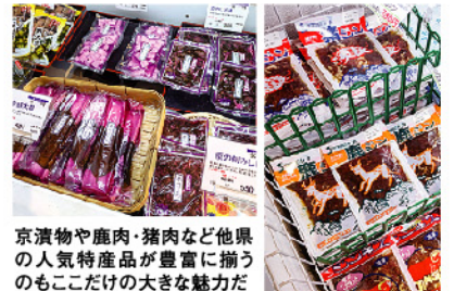
京漬物や鹿肉・猪肉など他県の人気特産品が豊富に揃うのもここだけの大きな魅力だ