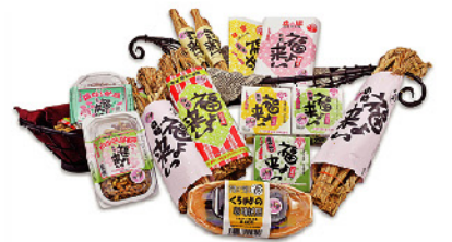
地元産大豆100%使用の出来たて下妻納豆「福来い」が買えるのは道の駅しもつまだけ