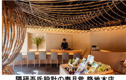
隈研吾氏設計の寿月堂 築地本店