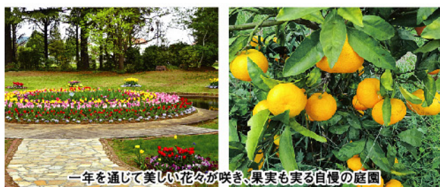
一年を通じて美しい花々が咲き、果実も実る自慢の庭園

協栄江戸川台年金ホーム ヴィラ・ナチュラ お元氣なうちから考える、花と緑があふれる終の「すまい」