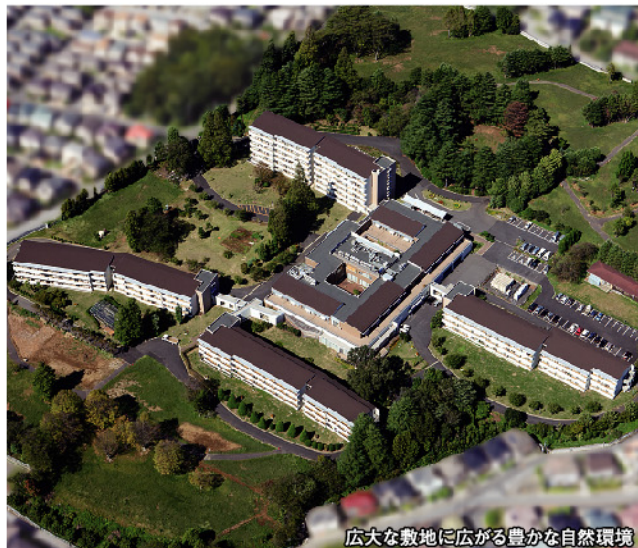
広大な敷地に広がる豊かな自然環境

美しい庭園 敷地は東京ドーム約1.5個分。園芸専用スタッフが丹精込めて育て上げた花と緑は圧巻。梅、桜の花吹雪のほか、バラ、チューリップなど季節の花々の移ろいを見て・感じて毎日楽しく散歩ができる。池ではカルガモの親子が泳ぎ、芝生の上でヤギがくつろぐ。 居室も共用部も広々 お元氣な方々の一般居室は全室南向きでベランダ付き、約35㎡まで7タイプ用意。ロビーをはじめ、先日から生涯にわたり安心と安全をヴィラ・ナチュラは約束してくれる。 ※入居者さまの行動によっては事業者から解除通告をする場合があります。