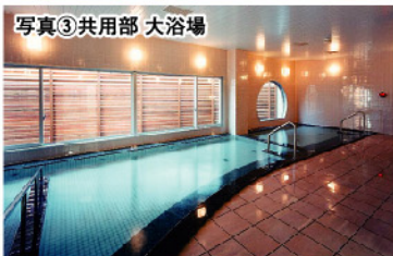
写真③共用部 大浴場

美しい庭園 敷地は東京ドーム約1.5個分。園芸専用スタッフが丹精込めて育て上げた花と緑は圧巻。梅、桜の花吹雪のほか、バラ、チューリップなど季節の花々の移ろいを見て・感じて毎日楽しく散歩ができる。池ではカルガモの親子が泳ぎ、芝生の上でヤギがくつろぐ。 居室も共用部も広々 お元氣な方々の一般居室は全室南向きでベランダ付き、約35㎡まで7タイプ用意。ロビーをはじめ、先日から生涯にわたり安心と安全をヴィラ・ナチュラは約束してくれる。 ※入居者さまの行動によっては事業者から解除通告をする場合があります。