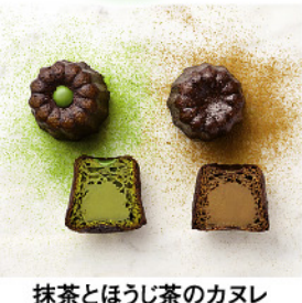
抹茶とほうじ茶のカヌレ