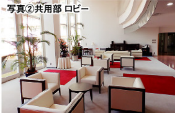
写真②共用部 ロビー