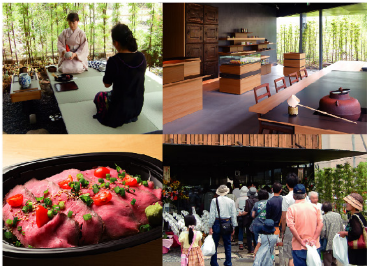
つくば工場まつりには毎回約5,000人のお客様がご来場

いののぶや 版画・飯野農夫也 大地に生きる(部分) 飯野農夫也画業保存会 http://www.inonobuya.com