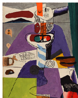
ル・コルビュジエ 《牡牛XVI》 1958年、ル・コルビュジエ財団(パリ)蔵