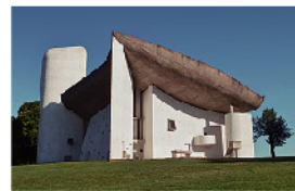
ロンシャンの礼拝堂 (フランス、ロンシャン) 1950-55年 南西からの眺め 建築:ル・コルビュジエ、撮影:下田泰也、2016年