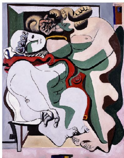
ル・コルビュジエ 《マッチ箱と二人の女》 1933年、森稔コレクション蔵

近代建築の巨匠として知られるル・コルビュジエ(1887-1965)は、視覚芸術の他分野においても革新をもたらした。本展では、1930年代以降に彼が手がけた絵画、彫刻、素描、タペストリーを紹介。彼が求め続けた新しい技術の芸術的利用にもスポットをあてる。