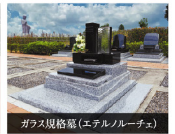
ガラス規格墓(エテルノルーチェ)