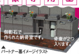
パートナー墓イメージイラスト