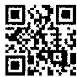
ホームページは こちらから

これは、沿線地域の風 景や歴史・文化などの魅 力を感じ、探訪してもら うことが目的。第1回は 11月23日(土・祝)に、「江 戸川から二郷半用水路 へ三郷のウォーターフ ロントを歩く」と題し、