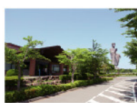
牛久浄苑管理事務所

※アンケートへのご記入を行って頂いた方に限ります。※1家族4枚までとさせていただきます。 ※墓所のご見学は、約1時間はどちらかかります。※過去にご利用いただいた方は、ご利用いただけません。