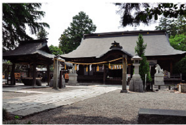
甲斐一宮・浅間神社は新治・筑波を眺めるかのように東側向きに建立

富士山を祀る浅間神社は、本来の名称は「あさま」であり漢字の音読みで「せんげん」と呼ばれてもいる。その「あさま」だが、学研古語辞典によると「あさま」は驚くばかりだ。意外だ。あきれるほどひどいなどと記載されている。つまり美しく神々しい富士山が突然の噴火で、「驚くほど悲惨な状況をつくり出している様子が伝わる。