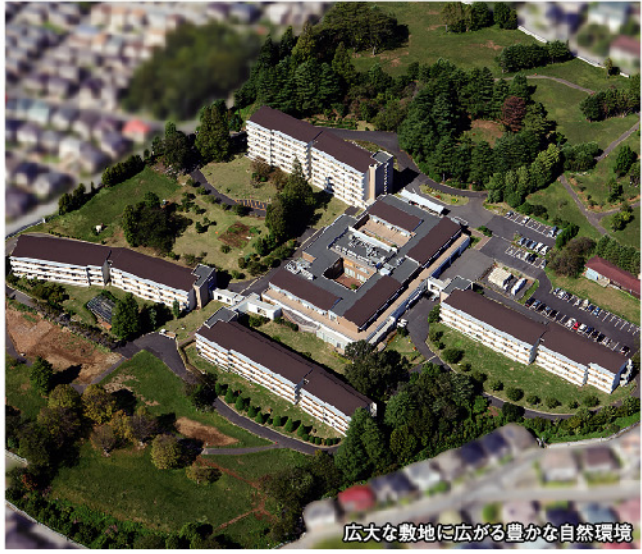
広大な敷地に広がる豊かな自然環境

美しい庭園 敷地は東京ドーム約1.5個分。園芸専属スタッフが丹精込めて育て上げた花と緑は圧巻。梅、桜の花吹雪のほか、バラ、チューリップなど季節の花々の移ろいを見て、感じて毎日楽しく散歩ができる。池ではカルガモの親子が泳ぎ、芝生の上でヤギがくつろぐ。 居室も共用部も広々 お元氣な方々の一般居室は全室南向きでペランダ付き、約35㎡まで7タイプ用意。ロビーをはじめ、先日から生涯にわたり安心と安全をヴィラ・ナチュラは約束してくれる。 ※入居者さまの行動によっては事業者から解除通告をする場合があります。