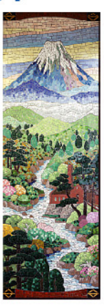
板谷梅樹(三井用水取入所風景) 昭和29(1954)年 板谷波山記念館蔵

泉屋博物館東京 tel.050-5541-8600 (ハローダイヤル) 東京都港区六本木1-5-1 https://sen-oku.or.jp/tokyo/ 会期 8月31日(土)~9月29日(日) 開催時間 11:00~18:00 ※金曜日は19:00まで閉館。 ※入館は閉館の30分前まで。 休館日 月曜日、9月17日・24日(火) ※9月16日・23日(月・祝)は開館。 入館料 一般1,200円 高校・大学生800円 中学生以下無料