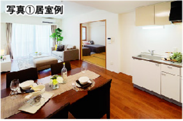
※家具・家電は付属しません。