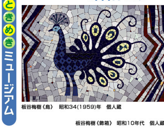
板谷梅樹(鳥) 昭和34(1959)年 個人蔵

「昭和」モダンのアートシーンを飾ったモザイク作家・板谷梅樹(いたやうめき、1907~1963)。近代陶芸の巨匠・板谷波山(いたやはざん、1872~1963)の息子であった梅樹は、波山が砕いた陶片の美しさに魅了され、20代半ばから陶片を活用したモザイク画の制作を志した。本展は、梅樹作品を一堂に集めた初の展覧会。高さ約370cmにおよぶモザイク壁画《三井用水取入所風景》をはじめ、エキゾチックなモザイク額、美しい飾篦やペンダントヘッドなどの愛らしい装飾品を通して、板谷梅樹の人となり迫る。