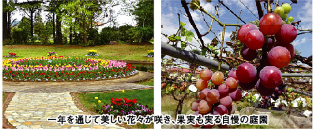
一年を通じて美しい花々が咲き、果実も実る自慢の庭園

協栄江戸川台年金ホーム ヴィラ・ナチュラ お元氣なうちから考える、花と緑があふれる終の「すまい」 住宅街に突如あらわれる広大な敷地。四季折々の花・緑で彩られる美しい庭園の中でお元氣なうちから最後まで、安心して第二の人生を過ごせる。入居条件は70歳以上で自立または要支援までの方が対象。