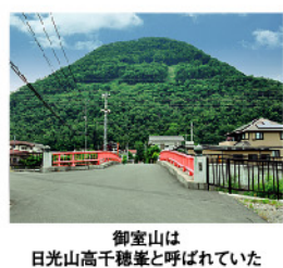
御室山は日光山高千穂峯と呼ばれていた

おはなし、絵や物語を集めて紹介。他方でこれらの資料には、昔の人々の生活の様子や、病気・不安と向き合うための知恵や工夫もつまっているという。