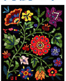
板谷梅樹(花) 昭和30年代 個人蔵

「昭和」モダンのアートシーンを飾ったモザイク作家・板谷梅樹(いたやうめき、1907~1963)。近代陶芸の巨匠・板谷波山(いたやはざん、1872~1963)の息子であった梅樹は、波山が砕いた陶片の美しさに魅了され、20代半ばから陶片を活用したモザイク画の制作を志した。本展は、梅樹作品を一堂に集めた初の展覧会。高さ約370cmにおよぶモザイク壁画《三井用水取入所風景》をはじめ、エキゾチックなモザイク額、美しい飾篦やペンダントヘッドなどの愛らしい装飾品を通して、板谷梅樹の人となり迫る。