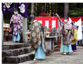
六所神社の保存に尽力する善照修徳会は毎年4月に六所大祭を実施

なぜ明治政府は、筑波の天地開闢説抹消に力を入れたのであろう。それは明治期の内外情勢が関係している。天皇陛下を国家元首と理解させるうえで、天照大御神を皇祖とする神話も重要になった。天照大御神の誕生は、記紀で非現実的な内容だが一面で神秘性を含み天皇制強化に不可欠の思考が背景にある。