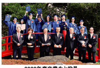
2022年度卒業生と役員

学校法人つくば文化学園(東郷治久理事長)が運営する「日本つくば国際語学院」の卒業式が3月10日、つくば市小野崎のつくば山水亭で行われた。新たな門出を迎えたのは、第四期生10名。新型コロナウイルスの影響で来日時期が異なり、全員揃っての入学式は行えなかったという。