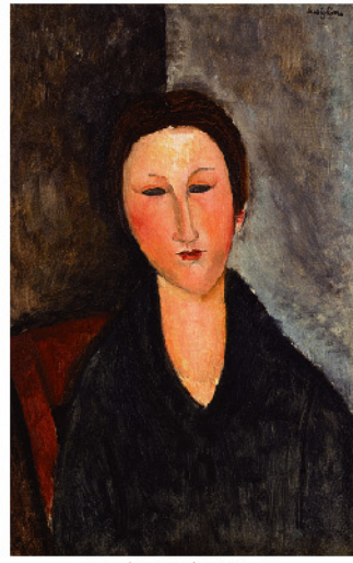
アメデオ・モディリアーニ 《若い女の胸像（マーサ嬢）》 1916-17年頃 油彩・カンヴァス