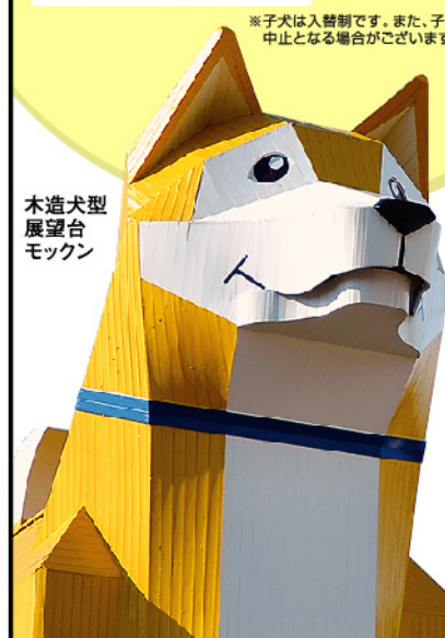
木造犬型 展望台 モックン

つくばわんわんランド 入園料割引券 大人(中学生以上)2,000円→1,700円 小人(3才~小学生)1,000円→800円 ●他のサービス・割引券との併用は不可。●1枚につき5名様まで有効。 ●2024年7月30日まで有効。