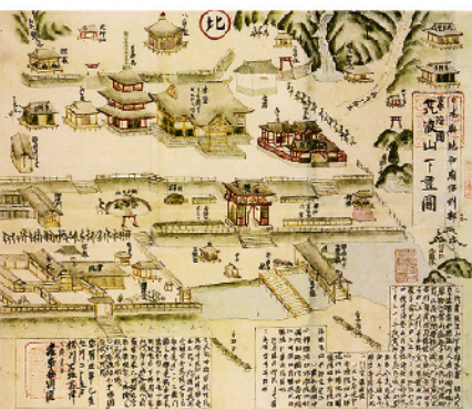
「常陸国筑波山下図」宝暦5年(1755)時の筑波山中禅寺(国立公文書館蔵)

拙著『日本のルーツ 筑波山』で、7代天神イザナギ・イザナミの「国生み・神生み」を西日本開発であるとした。私はオノコロシマを筑波山麓としており、国づくりの本拠地である条件として、人口や文化・産業などの高いレベルが必須であり、その条件を筑波山麓は満たしていた。私はイザナギ・イザナミの天地開闢を、考古学的視点などで4千年前と考えた。4千年前には、9割以上の人が東日本に集中しており、筑波山麓が日本の中心であったとする考えに妥当性が生まれる。その時期に縄文寒冷期と呼ばれる気候変動が発生、食料も安定し居住に最適であった東北地方(日高見国)の環境も激変している。そうした変化は、5900〜4200年前に存在していた三内丸山遺跡や多くの縄文遺跡から推測も可能であろう。 記紀などに登場する「国生み・神生み」神話では、登場する地域の殆どが西日本であり、その地の開発であったと考えることが自然だ。西日本を主基国と呼ぶのも鋤が土地開墾に使用される農具であり国名の由来とした。 ホツマツタエ以外の文献では、征服された地域として関東や東北地方が登場する。そこに縄文時代遺跡から判断する事実との矛盾が生まれている。少し前までの歴史書には、文化の遅れた異民族の存在が強調されていた。だが三内丸山遺跡などから考えると従来の認識と全く異なる日本の姿が見えてくるようだ。茨城県に生まれ育った一人として今回の神話物語では、民間の伝承行事などにも注視して精査したい。 歴史的に万葉集や常陸風土記に登場する筑波山は、神仏習合の聖地であり霊峰として崇められていた。そのため「筑波講・御六神講・大同講」と称される地域宗教行事があった。 講は筑波山頂に鎮座するイザナギ・イザナミの筑波山二社(男体山神社・女体山神社)や山中の稲村神社(アマテル)、渡神社(ヒルコ)、小原本神社(ツキヨミ)、安座常神社(ソサノヲ)などを崇拝し、子孫繁栄や豊作そして健康の祈願が行われていた。そのため六所神社(六所皇大神宮)、知足院中禅寺(筑波山神社)の発行する神の依り代「御影」を受け取り儀式を催した。 こうした風習や神社参拝の歴史が不明確になった要因に、明治維新の政策である神仏分離と廃仏毀釈があるようだ。筑波地域の神社をめぐる政府の対応は結果として異常な文化破壊に繋がった。それまで神仏一体の宗教思想で歩み、現在の筑波山神社の地には、徳川幕府から手厚く庇護された筑波山知足院中禅寺があり、山麓に目を向ければ勅使来訪の格式を持ち徳川家光の奉納品などを有する六所神社が鎮座していた。 明治元年(1868)に中禅寺は廃寺になり、六所神社も明治41年(1908)に蚕影神社との合祀により廃社させられた。神武4年の創建とも伝わっており日本有数の古社だけに不思議である。勅使来訪や坂上田村麻呂が鳥居など奉納した歴史ある神社へのこうした行為からも、国家の意図を感じてしまう。(続く)