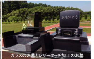
ガラスのお墓とレーザータッチ加工のお墓