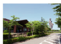
牛久浄苑管理事務所

※アンケートへのご記入を行って頂いた方に限ります。※1家族4枚までとさせていただきます。 ※墓所のご見学は、約1時間ほどかかります。※過去にご利用いただいた方は、ご利用いただけません。