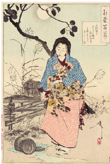
月岡芳年(つき百姿 千代能) 明治22(1889)年 浅井コレクション

落合芳幾と月岡芳年の前身の新聞錦絵を描くようになり、一方、芳年は、幕末を代表する浮世絵師である歌川国芳の門下で腕を磨き、良きライバルとして人気を二分した。その後、芳幾は発起人として関わった「東京日々新聞」(毎日新聞)の京日々新聞(毎日新聞)二人の全貌を、貴重な個人コレクションを中心に、肉筆画なども交えて紹介。浮世絵衰退の時代にあらうべく、彼らがどのように闘ったのかを振り返る。