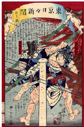
落合芳幾(東京日々新聞百一十号) 明治7(1874)年 毎日新聞社新屋文庫