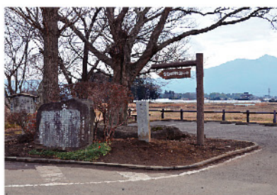
晴明の架けたと伝わる晴明橋をイメージした小公園(筑西市猫塚)