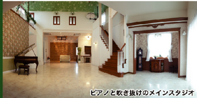
ピアノと吹き抜けのメインスタジオ