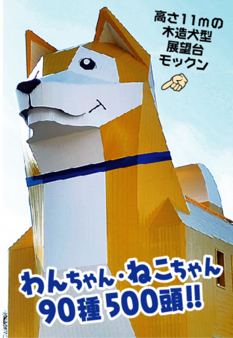
高さ11mの木造犬型展望台モックン