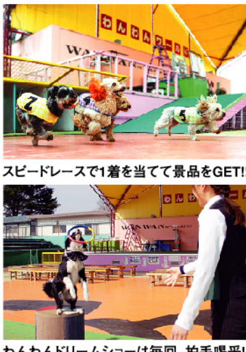
スピードレースで1着を当てて景品をGET!!

筑波山のそばにある日本最大級の犬のテーマパーク「つくばわんわんランド」で、90種500頭の犬や猫と一緒に過ごしませんか? 園内では、大迫力の「スピードレースショー」や芸達者な犬たちによる「わんわんドリームショー」などのイベントが、毎日盛りだくさん!好きな犬を選んで散歩したり、さまざまな種類の犬と直にふれあうこともできます。園内で生まれた子犬を間近に見られる「子犬展示館」や、驚くほど大きくて珍しい犬がいる「大型犬展示館」、猫たちがのんびり暮らす「ねこハウス」も人気です。 もちろん、ご自宅のペットのわんちゃんを連れての入園もOK。週末や連休には特別イベントが開催されることもあるので、お出かけ前にホームページをチェックして!!