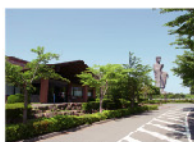
牛久浄苑管理事務所

※アンケートへのご記入を行って頂いた方に限ります。※1家族4枚までとさせていただきます。 ※墓所のご見学は、約1時間ほどかかります。※過去にご利用いただいた方は、ご利用いただけません。