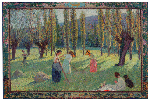
アンリ・マルタン 《二番草》 1910年 油彩/板 69×100cm フランス、個人蔵

19世紀末から20世紀初頭のフランスで活躍した画家、アンリ・ル・シダネルとアンリ・マルタンに焦点をあてた、国内初の展覧会です。印象派を継承しながら、新印象主義、象徴主義など同時代の表現技法を吸収して独自の画風を確立した二人は、幻想的な主題、牧歌的な風景、身近な人々やその生活の情景を、親密な情感を含めて描きました。「最後の印象派」と言われる世代の中心的存在であった二人は、それぞれの活動拠点に由来して、異なる光の表現を追求しました。シダネルは北フランスに特有の霞がかかった柔らかな光を、マルタンは南仏の眩い光を描き出しました。本展では、世紀末からモダニズムへ至るベル・エポック期に、独自の絵画世界を展開した二人の道のりを、約70点の油彩・素描・版画を通して辿ります。