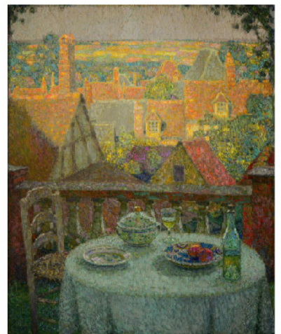
アンリ・ル・シダネル 《ジェルプロワ、テラスの食卓》 1930年 油彩/カンヴァス 100×81cm フランス、個人蔵 © Luc Paris

19世紀末から20世紀初頭のフランスで活躍した画家、アンリ・ル・シダネルとアンリ・マルタンに焦点をあてた、国内初の展覧会です。印象派を継承しながら、新印象主義、象徴主義など同時代の表現技法を吸収して独自の画風を確立した二人は、幻想的な主題、牧歌的な風景、身近な人々やその生活の情景を、親密な情感を含めて描きました。「最後の印象派」と言われる世代の中心的存在であった二人は、それぞれの活動拠点に由来して、異なる光の表現を追求しました。シダネルは北フランスに特有の霞がかかった柔らかな光を、マルタンは南仏の眩い光を描き出しました。本展では、世紀末からモダニズムへ至るベル・エポック期に、独自の絵画世界を展開した二人の道のりを、約70点の油彩・素描・版画を通して辿ります。