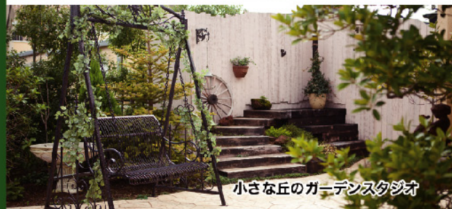
小さな丘のガーデンスタジオ