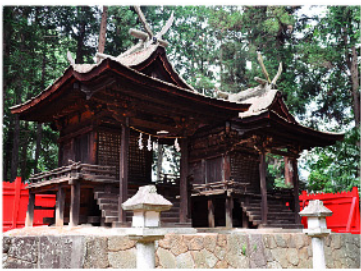
甲州市塩山の熊野神社本殿。拝殿と共に国指定重要文化財

全国発送承ります ※お車で越しの方は、店頭駐車場、または第2駐車場をご利用下さい。 動画ホームページあみゆめで検索!