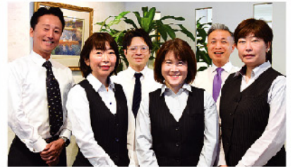
認定補聴器専門店「柏補聴器センター」には認定補聴器技能者が3名在籍