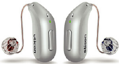
▲オーテイコン インテント

先述の「認定補聴器技能者」は、公益財団法人テクノエイド協会が厳しい条件のもと認定する資格。4年間の実務と講習期間を経て試験に合格することで資格が得られ、取得後も5年おきに講習を受け、更新する必要があります。そして、聴力の測定や補聴器の調整に必要な設備を備え、補聴器相談医の指導